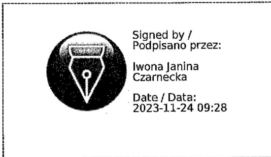
graficzny symbol podpisu elektronicznego