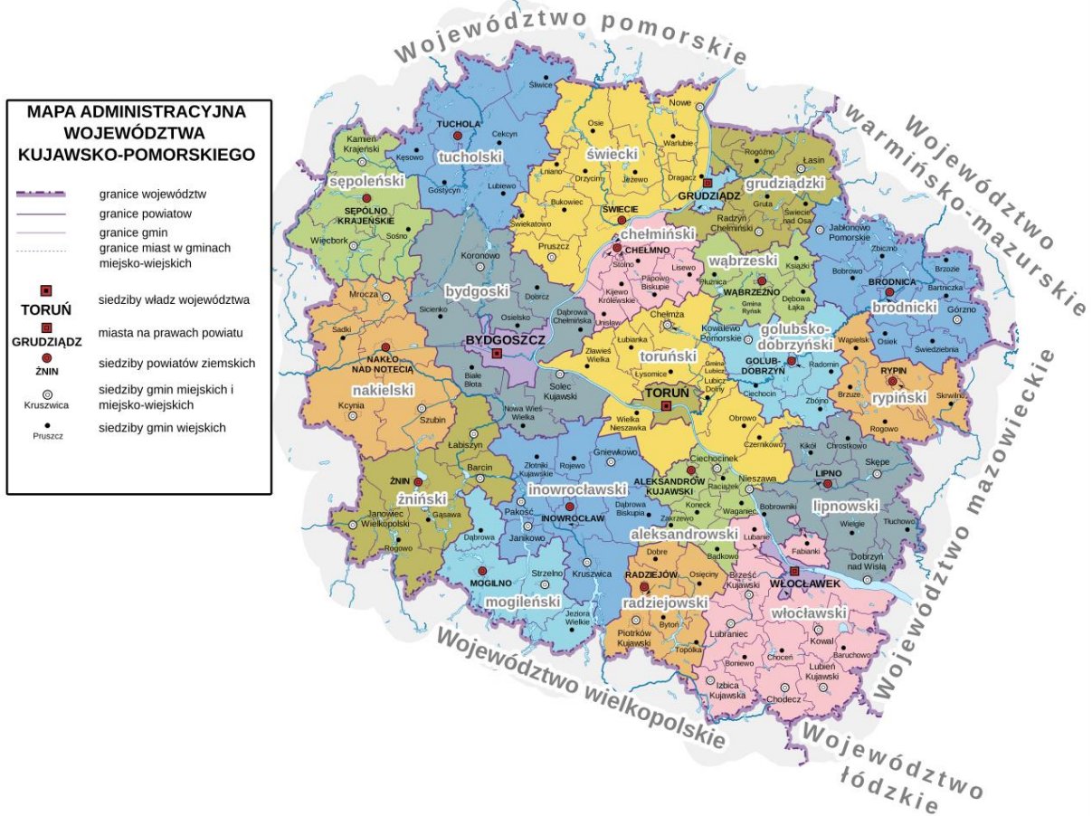
Rysunek 1. Województwo kujawsko-pomorskie