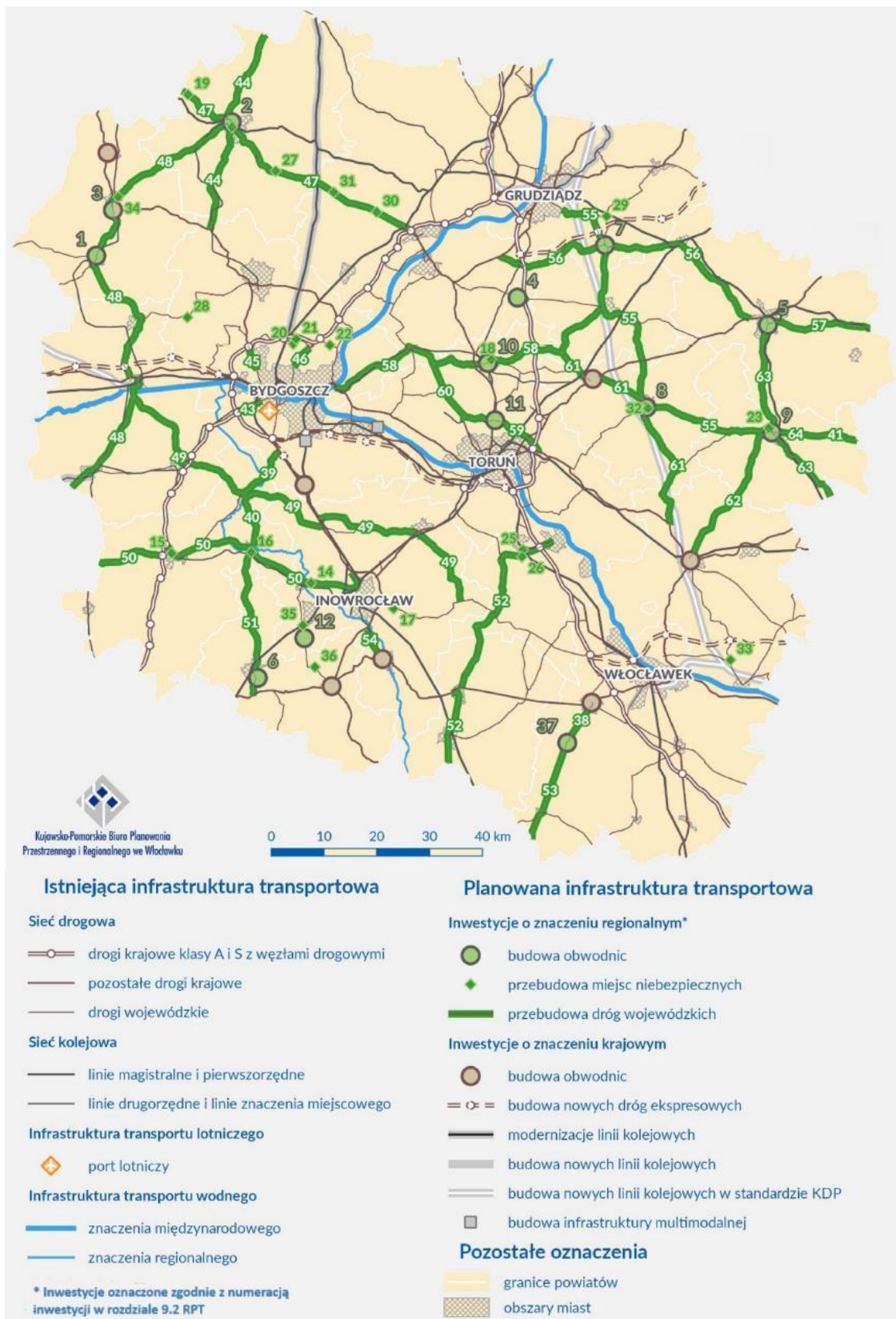
Rysunek 2. Mapa inwestycji planowanych do realizacji w perspektywie 2021-2030

Źródło: Regionalny Plan Transportowy Województwa Kujawsko-Pomorskiego na lata 2021-2027